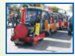
Die Oldtimerbahn fährt über das gesamte Veranstaltungsgelände.